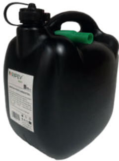
JERRICAN RIPEV AUTO RIP518

Homologado para o transporte de mercadorias perigosas (UN-Y 1,2)