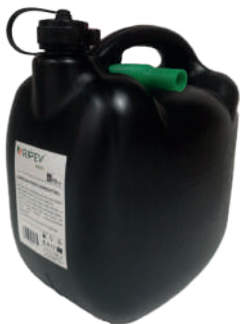
JERRICAN RIPEV AUTO RIP519

Homologado para o transporte de mercadorias perigosas (UN-Y 1,2)